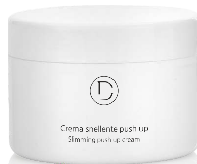
Crema snellente push up Slimming push up cream

CONTIENE: SVELTINE®, ESCINA, CAFFÈ, ZENZERO, POMPELMO, LAVANDA, GOTU KOLA, EDERA.